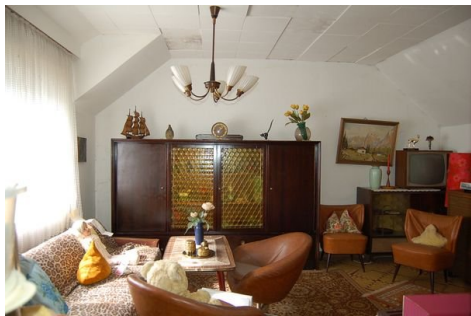
24 Zimmer 4.JPG