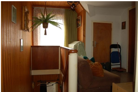
20 Flur oben.JPG