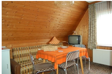
21 Zimmer 1.JPG