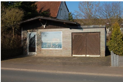
04 kleines Nebengebäude Garage.JPG