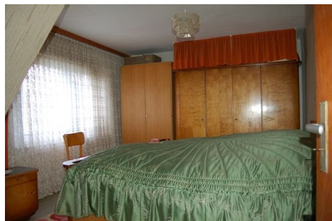
23 Zimmer 3.JPG