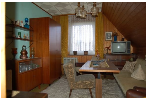
22 Zimmer 2.JPG