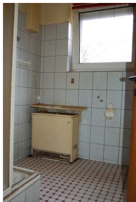
14 kleines Bad EG.JPG