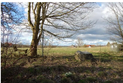
06 Ausblick hinten.JPG