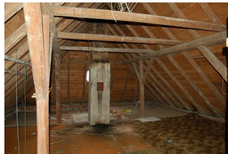
30 grosser Dachboden.JPG