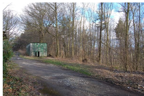
07 Ausblick vorne.JPG