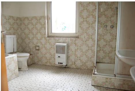
25 Badezimmer DG.JPG