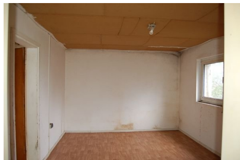
24 Zimmer DG.JPG