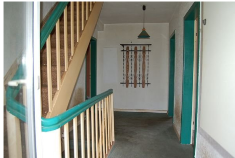
20 Flur DG.JPG