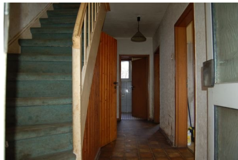
11 Flur EG.JPG