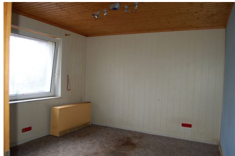
13 Zimmer EG.JPG