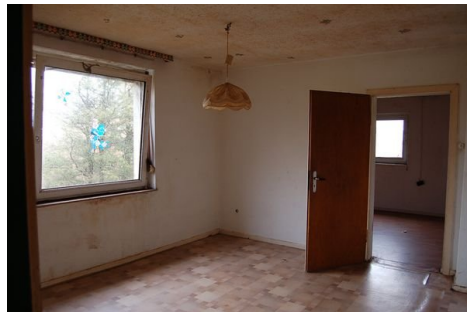
22 Zimmer DG.JPG