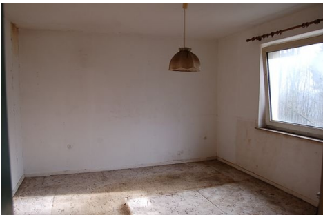
21 Zimmer DG.JPG