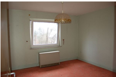
23 Zimmer DG.JPG