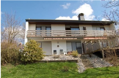
02 gesamtes Haus