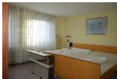
17 Zimmer OG