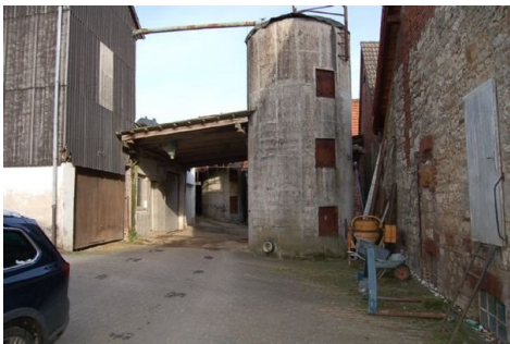
07 Hof mit Silogebäude