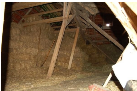
22 Dachboden als Heulager