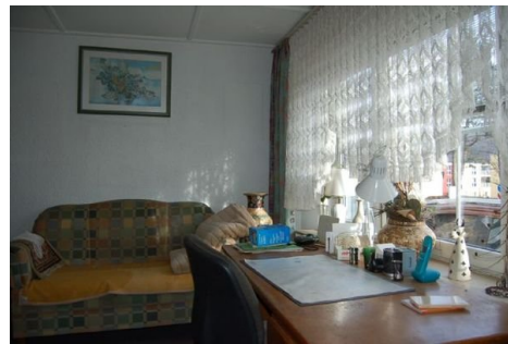
13a Zimmer EG