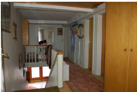
14 Flur OG