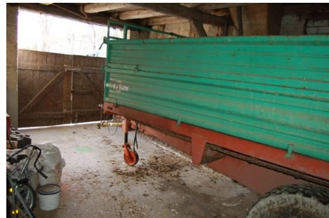
21 Tenne mit Platz für Mist-Anhänger