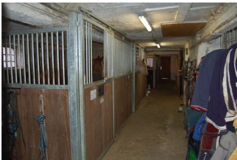
18 Stall mit Pferdeboxen