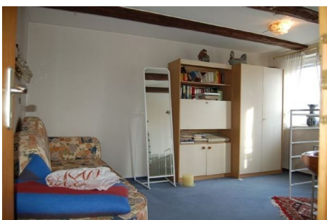
16 Zimmer OG