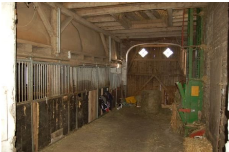
20 Diele mit Pferdeboxen